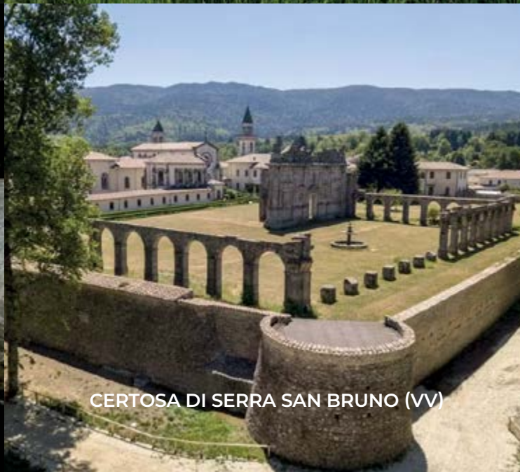
CERTOSA DI SERRA SAN BRUNO (VV)