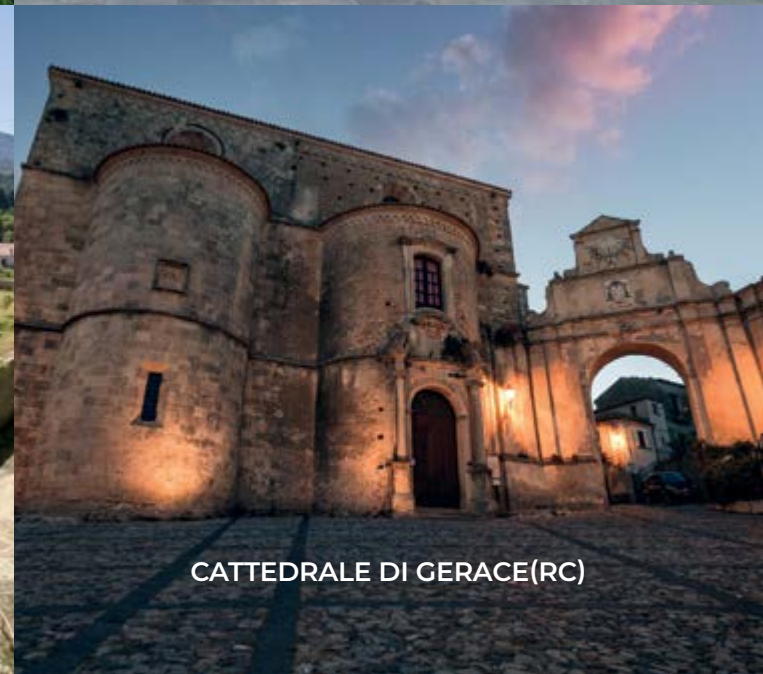
CATTEDRALE DI GERACE(RC)