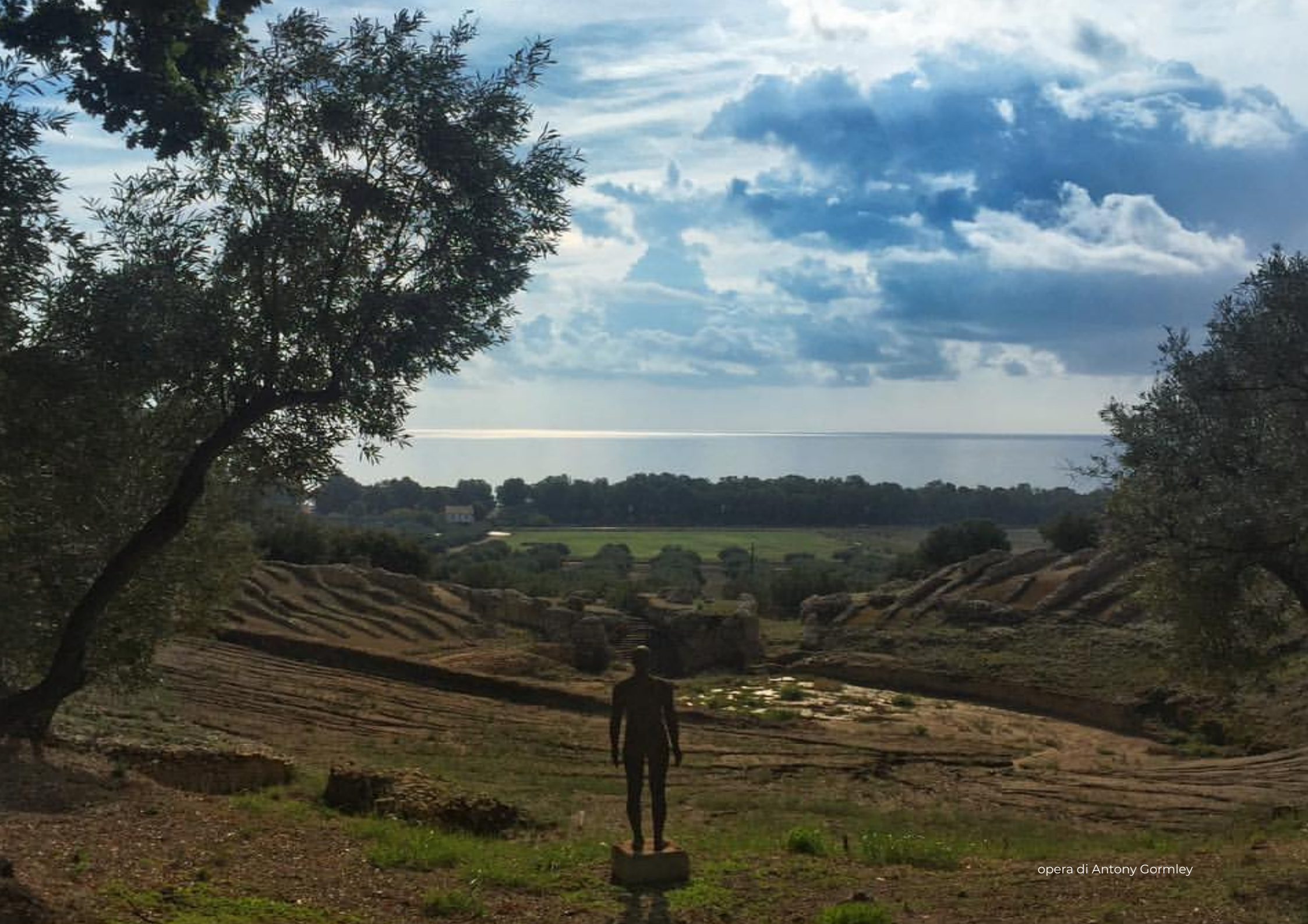
opera di Antony Gormley