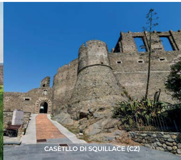
CASELLO DI SQUILLACE (CZ)