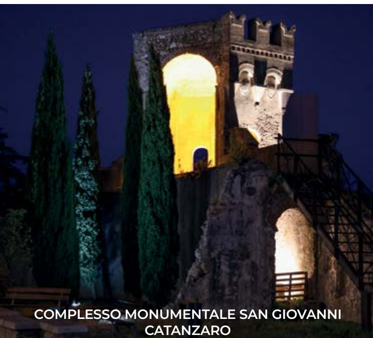
COMPLESSO MONUMENTALE SAN GIOVANNI CATANZARO