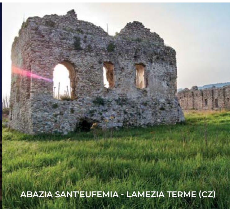
ABAZIA SANT'EUFEMIA - LAMEZIA TERME (CZ)